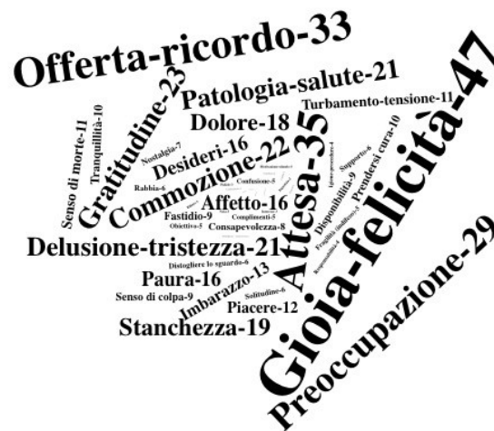
Figura 2. Wordcloud frequenza generale relativa ai codici rilevati

Nella Figura 3 può essere osservato il diagramma network risultato dall'analisi del materiale raccolto. In minuscolo vengono riportati i codici attribuiti durante l'analisi, in maiuscolo le "categorie", costruzioni dotate di maggiore astrazione.